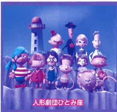
人形劇団ひとみ座