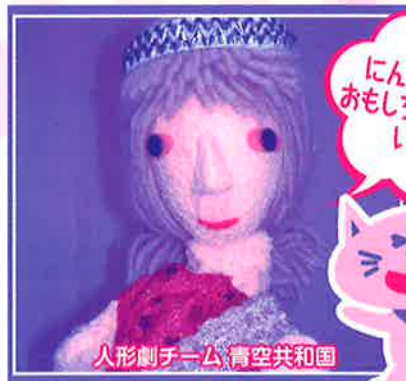
人形劇チーム 青空共和国