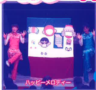
ハッピーメロディー