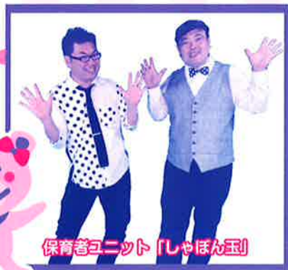
保育者ユニット「しゃぼん玉」