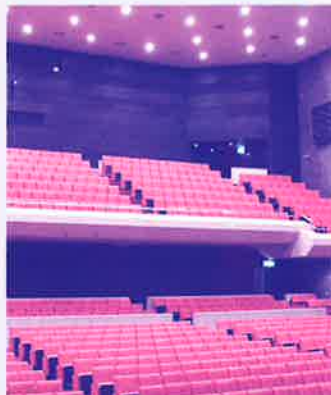
昭和57年11月オープン