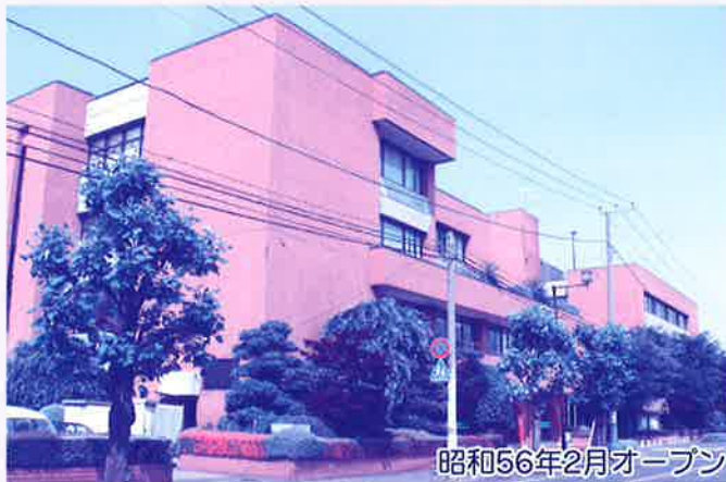
昭和56年2月オープン