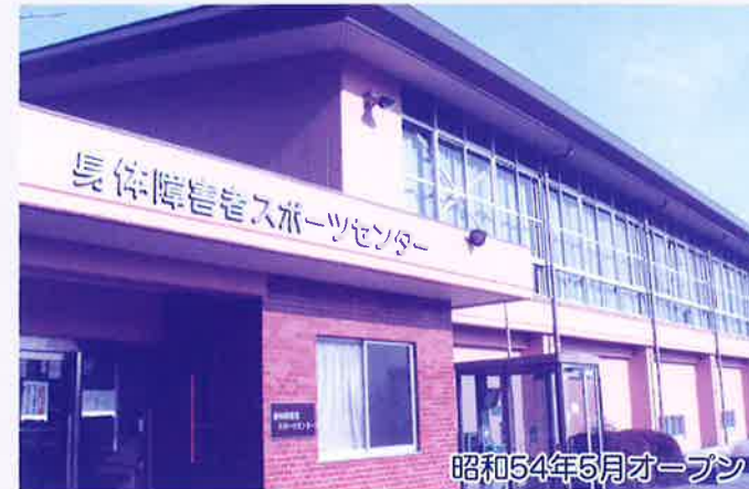
昭和54年5月オープン

アリーナ(816㎡) 会議室・更衣室2・シャワー室2 *毎月第1日曜日の終日と毎週水曜日の午後・夜間は身体障害者の専用です。