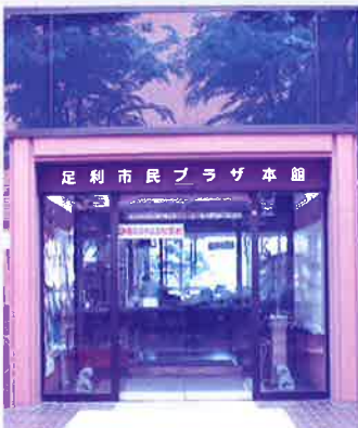
昭和56年2月オープン